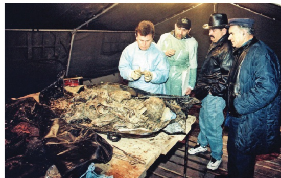
Identifikacija posmrtnih ostataka ubijenih Tovarničana ekshumiranih iz masovne grobnice na tovarničkom groblju u siječnju 1998.