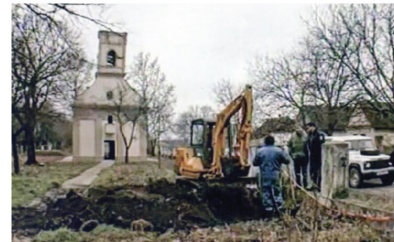
Ekshumacija posmrtnih ostataka Rafaela Glavaša iz grobnice u dvorištu svetišta Gospe Ilačke u siječnju 1998.

Knjiga svjedoči o stradanju i patnjama Hrvata i nesrpskog stanovništva iz dvaju sela, Tovarnika i Ilačke, u kojima je za vrijeme Domovinskog rata stradala 104 stanovnika.