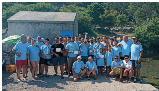
Ribarski dan 2021. SVI SUDIONICI RIBARSKOG DANA 21

Tradicionalno, i 2020. godine ŠRD Arbun je bio nosioc organiziranog obilježavanja dana Sv. Nikole. U sklopu zajedničke proslave, vjenčić u more na sjećanje svim preminulim pomorcima, ribarima i poginulim