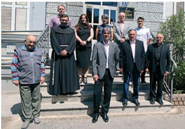
Predavači i organizatori znanstvenog skupa.