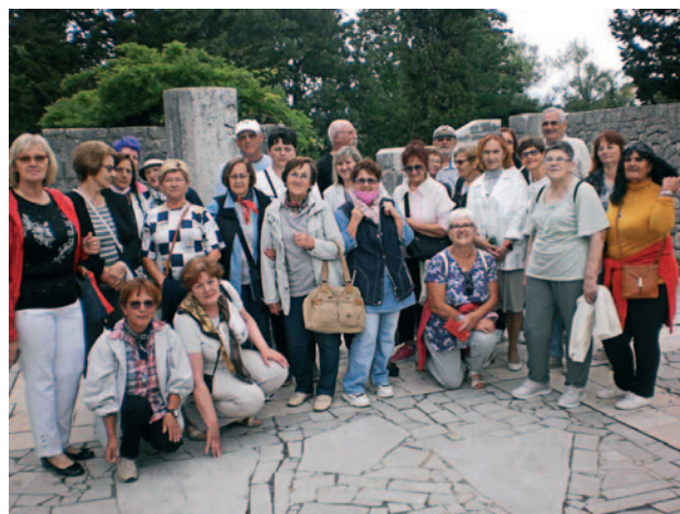
Članice ispred ulaza u spomen područja groblja logora Kampor

Za 08.03. Međunarodni dan žena posjetili smo sve bolesne i nemoćne članice, poklonivši im cvijet uz prigodnu čestitku. Tek 6. lipnja kad je epidemiološka situacija dozvolila organizirali smo tematski