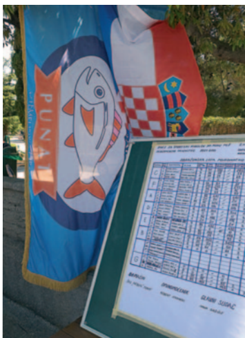
MOP-U16 30.05.21. DAN DRŽAVNOSTI-PRAZNIK RIBOLOVA U PUNTU

Za uspješno djelovanje društva pobrinuo se izvršni odbor, nadzorni odbor, tajnica i predsjednik. Predsjednik društva je sazivao sjednice izvršnog odbora kad god se za to ukazala potreba kao i uvijek prije određenih događanja kako bi se zajednički donesla odluka. Najvažniji događaj u poslovanju društva je svakako godišnja skupština, koja je održana 23.07.2021. godine, a na kojoj su se razmatrali rezultati za 2019. i 2020. godinu. Društvo je poziti-